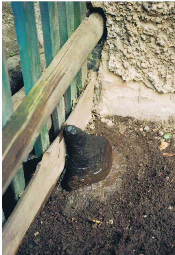
Abbildung 5. Stolpen – Vorwerk 18 (Juni/Juli 1992) im Vorgarten; Runder Basaltstein, Grenzstein oder Leckstein (?); Bereich Funde Scherben im Hof