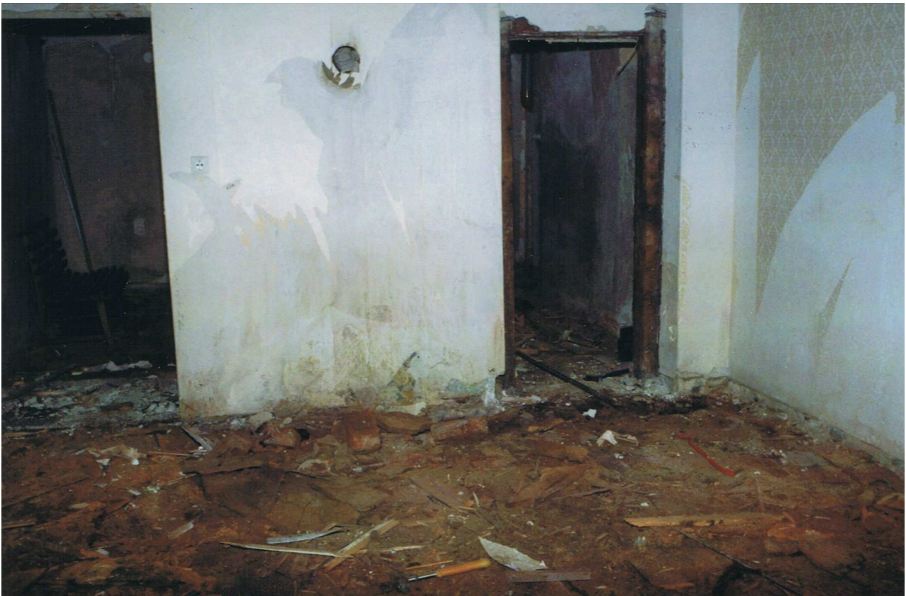
Abbildung 7 Stolpen-Vorwerk 12 (Zustand ca. 1991) Wohnstube mit abgebrochenen Dielen, Fundschichten Keramik