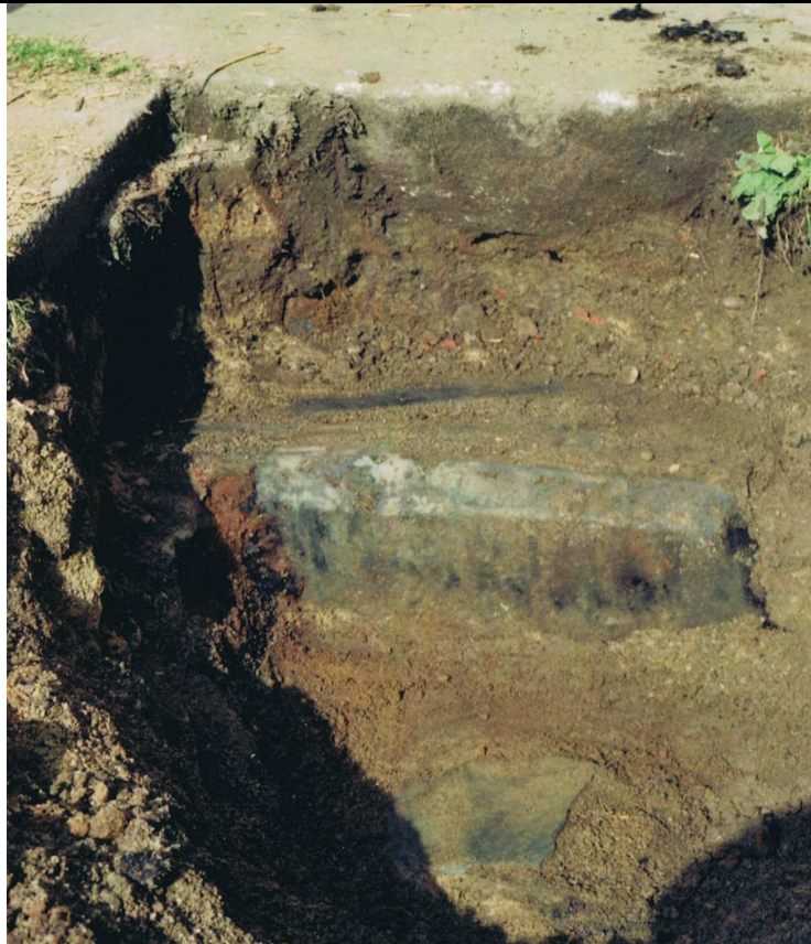
Abbildung 4. Stolpen – Vorwerk 18 (Juni/Juli 1992), Oberkante Hofbefestigung, darunter Basaltsäule (ehemalige Treppenstufe oder Hofbefestigung ?), Brandspuren an der Basaltsäule, anthropogene Auffüllungen oberhalb und unterhalb der Basaltsäule – Fundschichten Keramik-Scherben